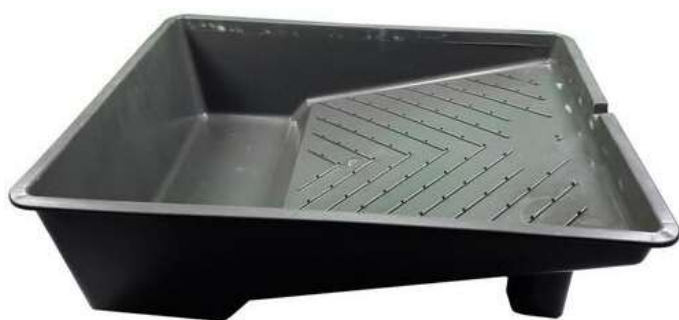
غلطک 15 سانتی متر و ظرف مناسب جهت اجرای پوشش پرایمر و پلی یورتان سطوح

• پس از چند روز از نصب و اطمینان کامل از خشک شدن سطح و عمق تایلها، سطح را به دقت بدون استفاده از آب نظافت نمایید. دقت نمایید در صورتیکه پیش از زدن پرایمر و لاک ، سطح کاملا نظافت نشده باشد و کثیفی یا فاک مشاهده گردد این کثیفی در زیر لاک مبس شده و دیگر تنها با استفاده از دستگاه پولیش قابل نظافت است.